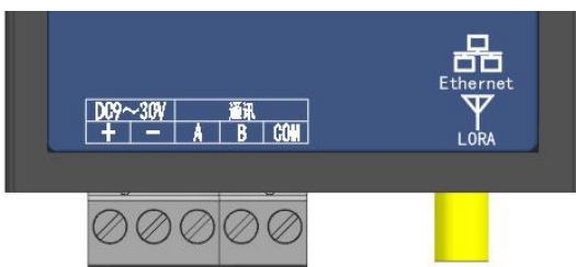
图3 AF-GSM300/400 接口